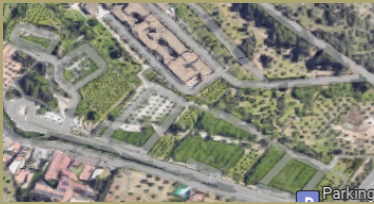
COMIENZO DE LA RUTA DESDE LAS TAQUILLAS al P.º del Generalife en dirección silla del moro