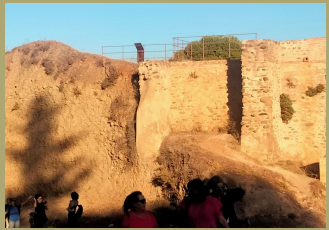
fortificación árabe perteneciente a la defensa y protección del Generalife y sus huertas, del siglo XIV,