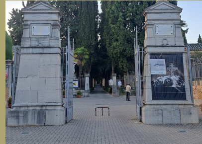
JARDÍN ARQUEOLÓGICO, PALACIO DE LOS ALIXARES