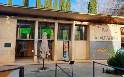
TAQUILLAS ACCESO ALHAMBARA PUNTO DE ENCUENTRO